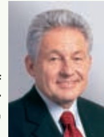
Dr. Josef Pühringer Landeshauptmann